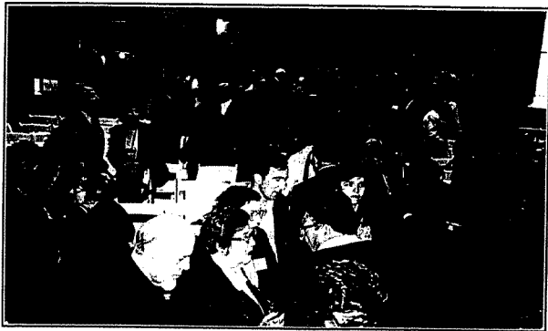
The gathering at the exhibition Ghetto Kovno, Washington