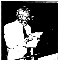
המנחה גרעון שוב