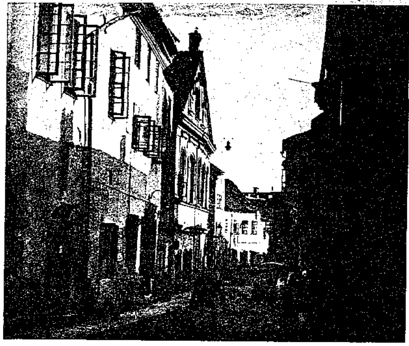
רחוב היהודים. ביהכ"ג הגדול אינו נראה, הוא מסתתר בין קלויז הגר"א ובין חצר ר' ליב לימור'ס.